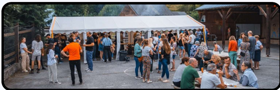
Fête de la musique du 21 juin 2024 p.8