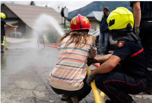
Animation au village de Villarembert le 18 août 2024.

Le centre de secours de montagne du Corbier réalise quant à lui 180 interventions par an sur les communes de Villarembert et Fontcouverte- la Toussuire. En saison d'hiver un effectif de garde composé de 3 à 6 sapeurs-pompiers professionnels et saisonniers est présent 24h/24h. L'effectif à l'année actuel est quant à lui de 9 sapeurs-pompiers volontaires dont 2 nouvelles recrues intégrées en 2024. Cela reste malheureusement insuffisant pour assurer la couverture opérationnelle de ce territoire en intersaison.