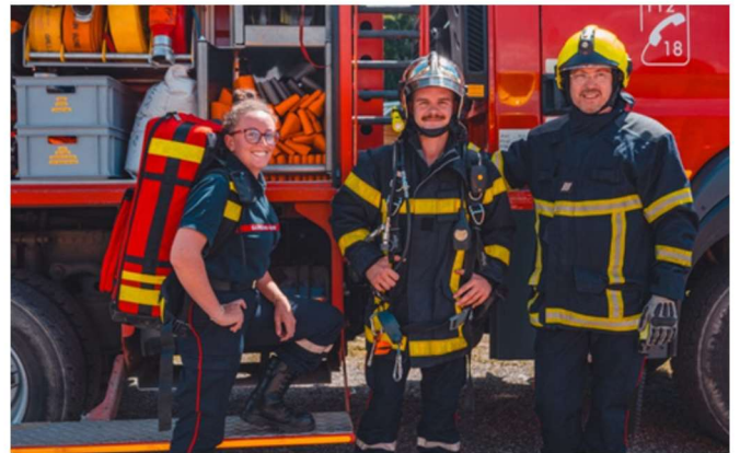
animation lors du 14 juillet 2024 sur le front de neige du Corbier.

C'est à ce titre que nous rappelons que les sapeurs-pompiers du Corbier recrutent et que toutes les personnes intéressées par cette activité peuvent contacter directement le centre d'incendie et de secours au 04.79.59.90.46 ou par mail : compagniemaurienne@sdis73.fr .