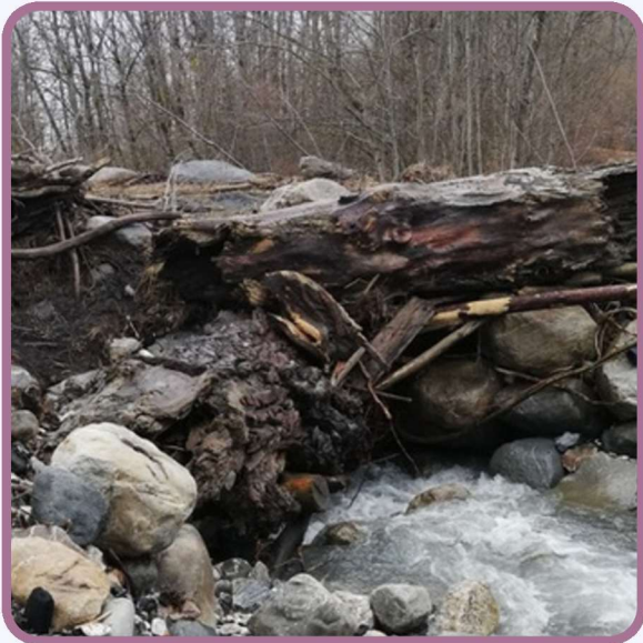
Les intempéries - automne 2023 p.4