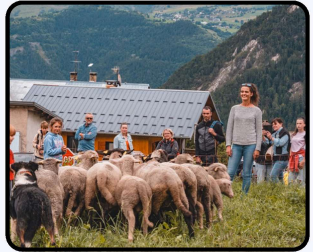
Fête des Rembertins p.5