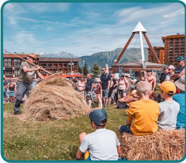
Fête du patrimoine au Corbier p.8