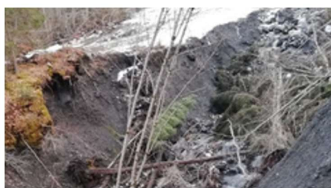
Passage Champlong avant

D'importants dégâts ont lieu lors des fortes intempéries survenues fin d'automne 2023. Plusieurs chemins communaux ont été ravinés voir emportés par des coulées de boue, notamment sur les secteurs du lac de l'Oeillette, le Pont de la Scie, les Pouillères et le passage de Champlong.