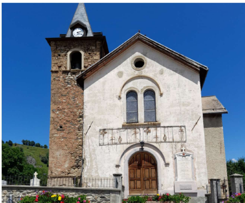
Eglise de Saint-Pierre-aux-Liens à Villarembert

L'appel aux dons s'adresse à tous, particuliers et entreprises souhaitant participer à la réalisation de projets patrimoniaux, mémoriels et historiques. La Fondation du patrimoine fera parvenir à chaque donateur un reçu fiscal.