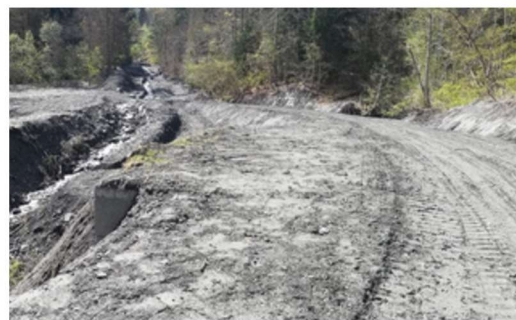
Passage Champlong après

Le département a attribué à la commune une aide financière au titre du programme " Fonds risques et érosions exceptionnels (FREE) " d'une hauteur de 34 420€ suite à ces intempéries.